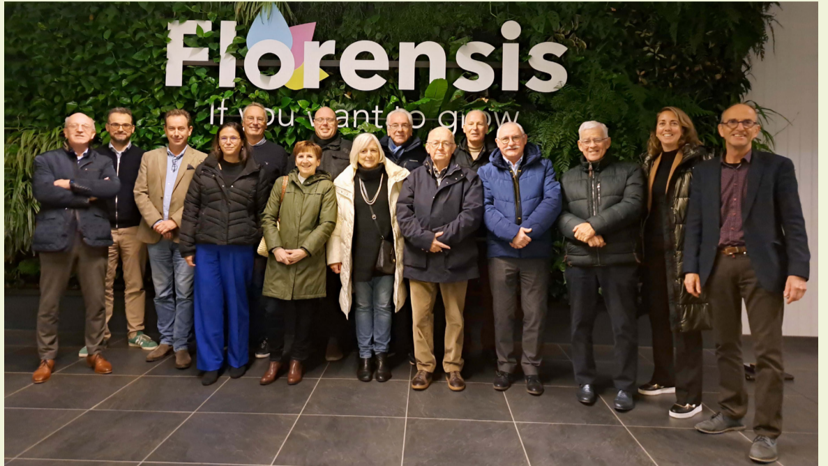
Meerdere keren per jaar bezoeken raad en college Ambachse bedrijven. Deze keer brachten zij een bezoek aan Florensis.

Florensis is opgericht in 1941 onder de naam Hamer Bloemzaden. Het bedrijf heeft productie- en veredelingslocaties in Nederland, Duitsland, Portugal, Kenia en Ethiopië. Met bijna 200 medewerkers in Nederland en 2.300 medewerkers wereldwijd levert het bedrijf jaarlijks een assortiment van 4.000 plantvariëteiten aan 8.000 professionele kwekers in 50 landen.