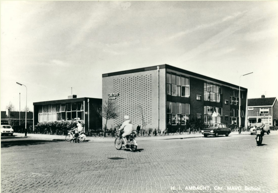
H. I. AMBACHT, Chr. MAVO School