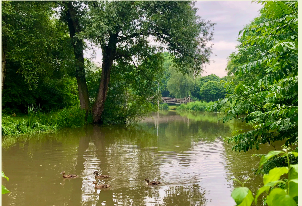
■ Bomen zijn belangrijk. Met behulp van de Digital Twin zetten we de juiste boom op de juiste plek.

Wilt u reageren op een plek waar de gemeente een boom gaat planten of heeft u vragen over het project? Stuur uw reactie of uw vraag uiterlijk woensdag 27 november naar groen@h-i-ambacht.nl . Kijk voor meer informatie over bomen en ons groenbeleid op h-i-ambacht.nl/groen .