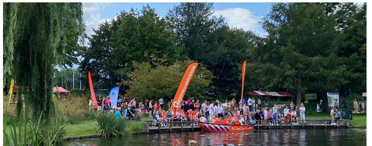
Reddingsbrigade Hendrik-Ido-Ambacht tijdens een eerdere Zomerparkdag. Ook dit jaar vindt u in Reddingsbrigade bij de vijversteiger in het Burgemeester Baxpark.

Ido-Ambacht en op instagram: reddingsbrigade_ambacht . We zijn bijna elke zaterdag van 14.00 tot 16.00 uur en dinsdag van 19.45 tot 21.15 uur in zwembad De Louwert. Kom gezellig eens langs!