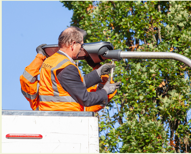
Vrijwel alle Ambachtse straatlantaarns zijn voorzien van LED-verlichting.

Meer info: h-i-ambacht.nl/SlimmeStraatlantaarns