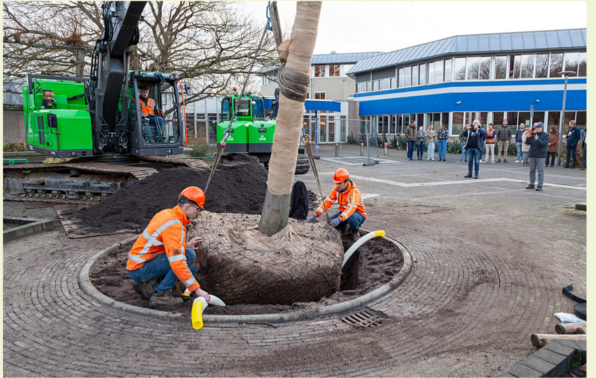
De nieuwe boom op het plein voor het Gemeentehuis versterkt het groene karakter van onze gemeente.

De toen opgerichte Stichting CAI fonds heeft sindsdien een impuls aan tal van projecten en voorzieningen in de Ambachtse samenleving gegeven.